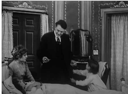
רופא הריאות מוריע לאחות הגדולה שהיא חולה בשחפת, בעוד אחותה הצעירה מבקשת ממנו לעזור ולרפא את אחותה. מתוך: Falling Leaves , USA 1912 (B&W, Silent), Director Alice Guy

לאור ההצלחה בהפצה הראשונית, החלה הרשות הפדרלית לבריאות הציבור להפיק ולהפיץ סרטי בריאות כמו הסרט העלילתי "עלי שלכת" ( Falling Leaves ) מ-1912, שמטרתם הסברה באמצעים ויזואליים. חלק מן הסרטים היו דידקטיים וחלקם סרטים עלילתיים קצרים. סרטי הבריאות התמקדו בדרכים חדשות ומוצלחות לשמור על היגיינה כדי לעצור את התפשטותן של מחלות ולשמור על הבריאות ככלל ועל בריאות מערכת הנשימה בפרט, בתקווה שהעלילה תמשוך את הקהל שבתקופה זו החל להתקרב לקולנוע. בשנת 1912 התפרסמו כתבות רבות על סרטי הבריאות, והמושג החל להתקבע בשיח הציבורי. הניסיונות לבלום את התפשטות המחלות בשנים 1914-1915 השפיעו על צריכת תרבות הפנאי. כך לדוגמה עודדו את הציבור בכל הגילים לצאת לפארקים במקום לבלות במקומות סגורים, ולשאוף אוויר נקי באזורים פתוחים מחוץ לעיר הגדולה. חלק מהעדויות מתארות עד 5,000 צופים בהקרנת סרטי בריאות בכל ערב, כלומר 60,000 בחדש וחצי. סרטים אלה הוצגו בחינם בפארקים גדולים בווישינגטון, בניו יורק, בבוסטון ובערים אחרות. הקרנת סרטי הבריאות בפארקים הציבוריים חינם אין כסף היא ראייה נוספת לחשיבות שייחסו הרשויות לנושא. הרשויות דאגו להפצה מכוונת ומהירה של סרטים. בין הסרטים שהופצו באותה תקופה: The Awakening of John Bold (1911); Fly Pest (1911); Falling Leaves (1912); The Temple of Molloch (1914); Kissing (1914); Germes (1914); The Red Cross Nurse (1914) 43 .