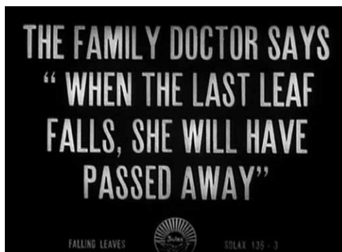
דבריו של הרופא למשפחה ואובדן התקווה לריפוי. מתוך: Falling Leaves , USA 1912 (B&W, Silent), Director Alice Guy

לטענת מומחים, סביב 1915 הצפיפות בערים הגדולות, המחסור באוויר נקי ותנאי סניטציה והיגיינה ירודים היו הגורמים להידבקות במחלות. לדבריהם אפשר היה להפסיק את ההדבקה באמצעות ניהול הלימודים בבתי הספר באוויר הפתוח, הגבלת משחקי ילדים במרכזי ספורט ומחוץ להם או אף איסור גורף על קיומם. 44 סרטי הבריאות עצמם הוקרנו גם במקומות הומי אדם וגם באולמות קטנים, והצפייה בסרטים העמידה רבים בסכנת הדבקה.