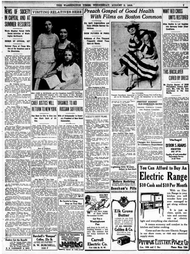
ידיעה על הקרנת סרטי בריאות בפארקים בבוסטון, לטובת הסברה לציבור הרחב. The Washington Times , August 2, 1916

למניעת המחלה בקרב יהודים במודעה בעיתון היהודי המרכזי, The Jewish Chronicle , כבר בשנת 1910, כארבע שנים לפני פרסום קיומם של סרטים אלה בעיתונות היהודית האמריקנית. 50 המאמרים והידיעות בעיתון מעידים על מודעות ראשונית ועל התייחסות לנושא. הייתכן שרשויות הבריאות והרווחה האנגליות קשרו בין מספרי החולים בקהילה היהודית ובין מגוריהם הצפופים ותנאי עבודתם בערים גדולות ותעשייתיות כמו לונדון,